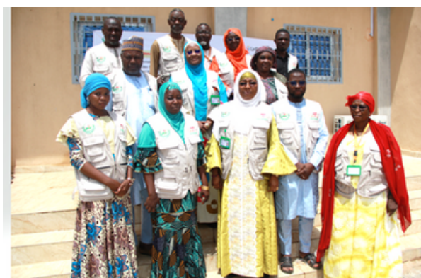
Equipe d'organisation de la 3ème réunion de coordination : Zinder 2023