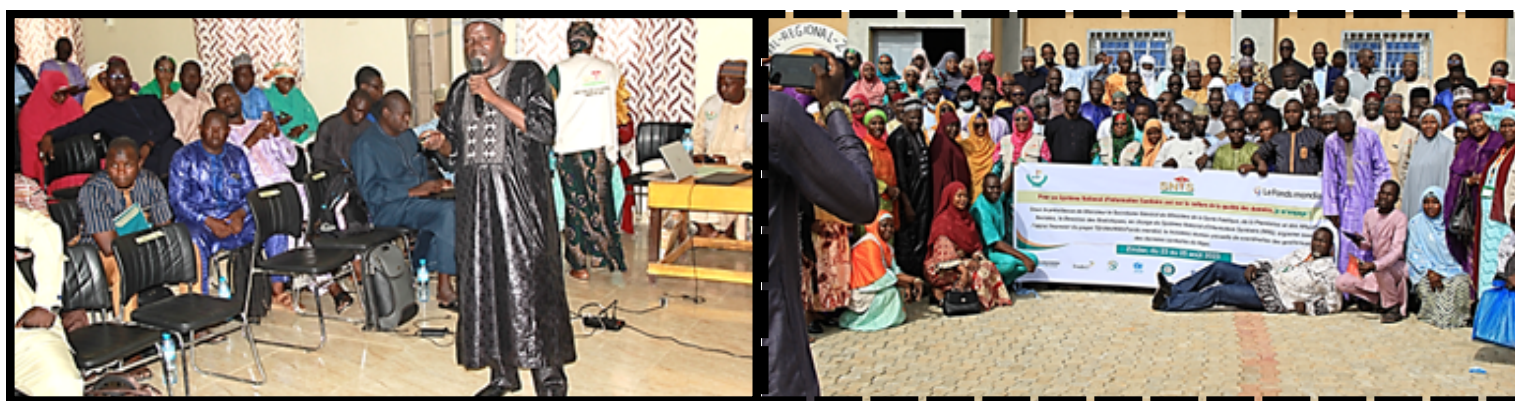
Vue des participants à la troisième réunion de coordination de Zinder du 23 au 25/08/2023

Ensuite, le gouverneur de la région de Zinder qui a procédé à l'ouverture de la réunion, a rappelé l'objectif général de la réunion qui est de contribuer à l'amélioration de la gestion des données sanitaires de routine au Niger. Il a notifié dans son discours que la santé de la population nigérienne est l'une des préoccupations majeures du Conseil National pour la Sauvegarde de la Patrie.