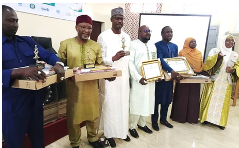
Remise des prix aux lauréats : Zinder 2023

La Promptitude-Complétude globale au S1 2022 et 2023 ont aussi été présentées.